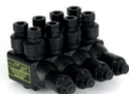
Conector de Derivacion Piranha