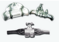
Abrazaderas de suspension