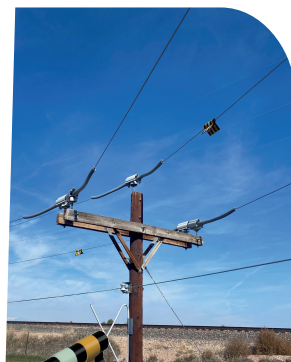
Desviador de Aves Hawk Eye