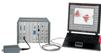
Medición de Descargas Parciales PDIX