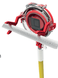
Inspección de líneas- SAFECAM