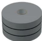
Cinta de Fusion